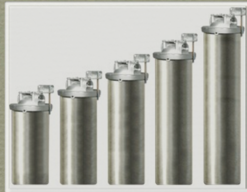
серия HMF-10B и HMF-20B. Размерность Big Blue (под картриджи диаметром 112 мм)