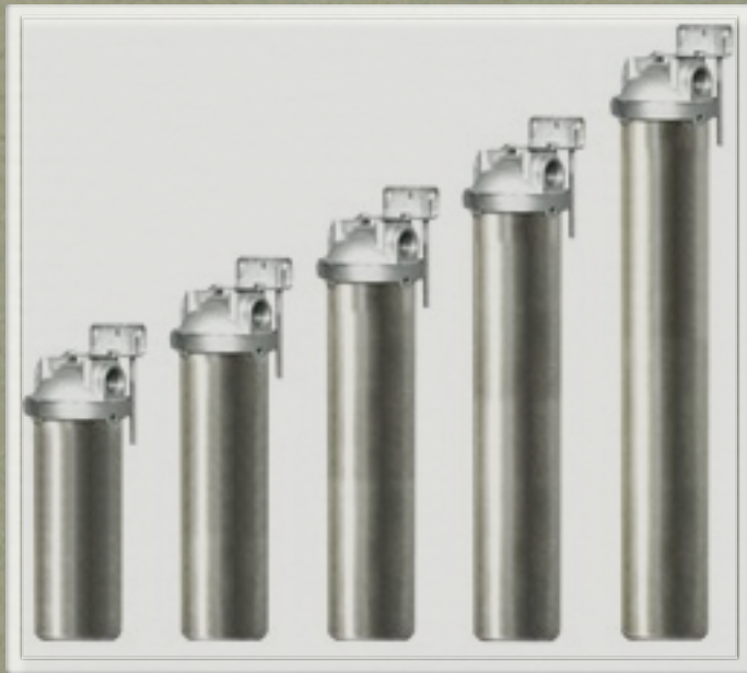
серия HMS-10B. Размерность slimline (под картриджи диаметром 63 мм).

Для очистки горячей воды применяются колбы (фильтродержатели) выполненные из нержавеющей стали. Рабочее давление до 6 Бар. Производительность по очистке от 0,1 до 6 м 3 /ч, в зависимости от типа применяемого картриджа.