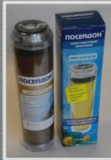
ЭФИО (диаметр 70 мм, высота 250 мм)

Картриджи с ионообменной смолой. Предназначены для умягчения воды.